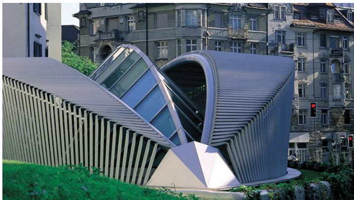
Kantonspolizei St. Gallen

Angeschmiegt an die alte Stadtmauer setzt dieser Bau von Santiago Calatrava - mit seinem beweglichen Dach - einen einmaligen Akzent.